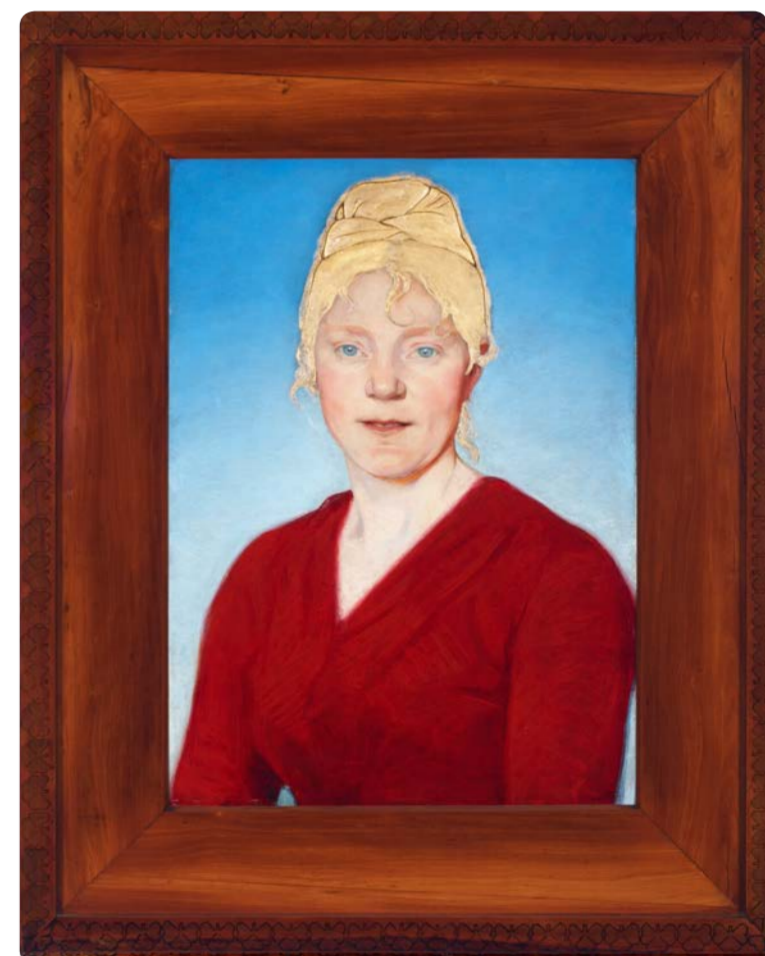
Maleren Harald Slott-Møllers portræt af Anne Marie før hun blev gift. Portrættet blev malet, da han og hans hustru var på ferie i Anne Maries barndomshjem ved Thygesminde ved Kolding og var tiltænkt en kunstsamler. År senere dukkede maleriet op hos en glarmester i et vindue, og Carl-Nielsen-parret overvejede at anlægge sag, fordi det "kostede dem en del lærgelser", som Carl Nielsen udtrykte det til en af sine venner. Parret endte dog med at købe det, så Anne Marie ikke skulle hænge i et vindue. Og det dukkede derefter først op igen mange år senere i deres datters bo efter hendes død. I dag er det på Carl Nielsen-museet i Odense.